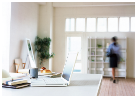
入居者間の交流をメインの目的としています

入居者間の交流、ふれあひも大事にする住環境を取り入れるのも、これからの賃貸経営の選択肢かもしれません。