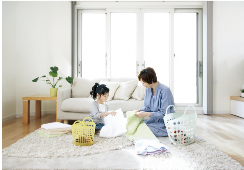
入居者が賃貸住宅を選ぶ目安として、家賃、立地・環境、部屋の広さ・設備の3点がメインになっているのがよく分かります

賃貸経営で失敗しない為の最新ニュースを皆様へ！ 賃貸物件の管理・経営に関するご相談は、「EST」へおまかせ下さい！